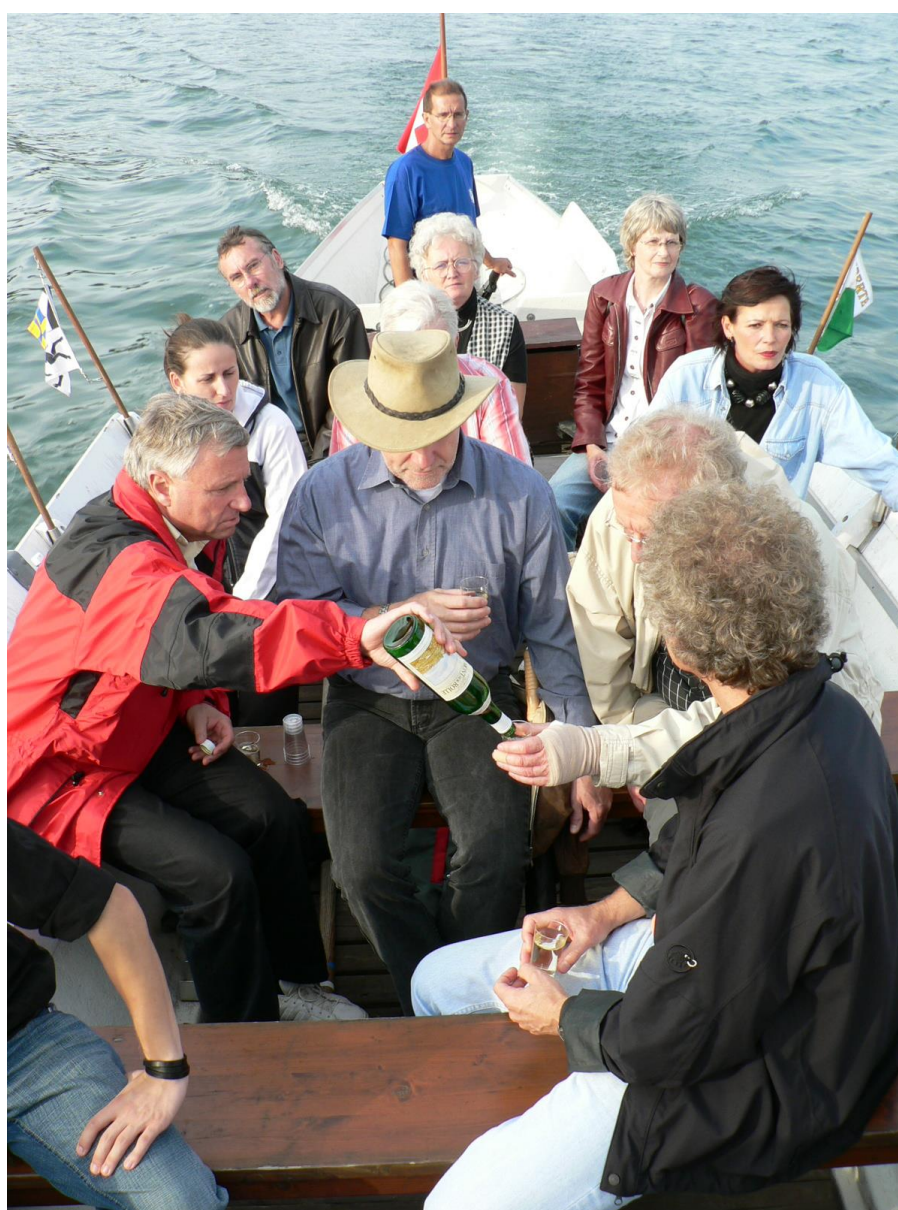
Apéro im Langboot uf em Rhy