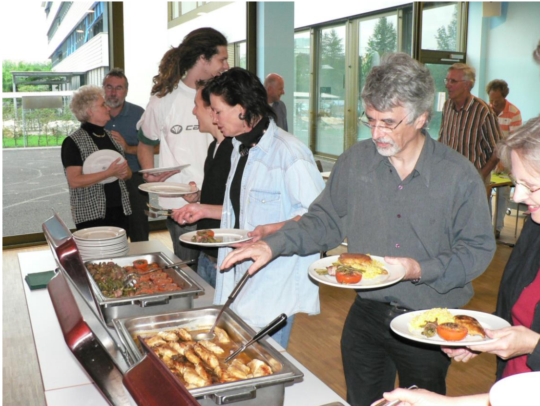
ma, ma, mutschi, eeeeen Guete!